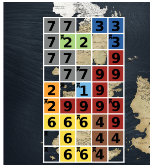
Figura 2: Soluzione parziale: 9 castelli su 12 castelli sono associati con una suddivisione valida.