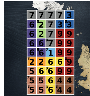
Figura 3: Soluzione ottima: tutti i castelli (12/12) sono associati con una suddivisione valida.